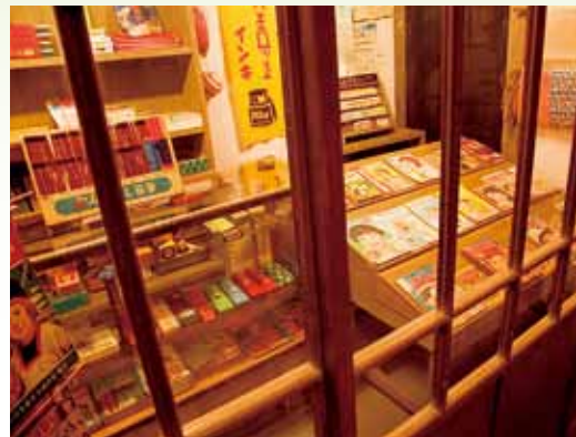
昭和の子ども図鑑(展示イメージ)

テレビが普及する昭和30年代まで、子どもの娯楽の中心にあった紙芝居。「お笑いユーモア」「チャンバラ時代劇」「活劇ヒーロー」「怪奇ホラー」など、子ども心をわくわくドキドキさせた紙芝居の世界が展示室によみがえります。また、思い出の味としてキオクに残るお菓子の数々。パッケージ、広告人形、看板から、懐かしいお菓子の歴史を振り返ります。そのほか、子ども雑誌、キャラクターおもちゃなどを展示。昭和の子どもが楽しんでいたモノが大集合します。