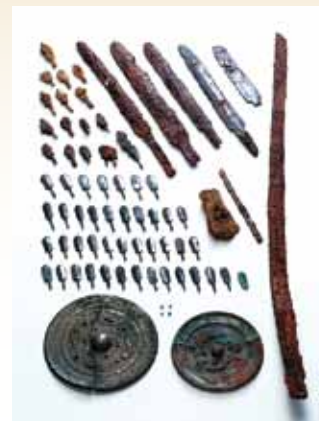
朝日谷2号墳出土遺物(松山市立埋蔵文化センター蔵)

2世紀から3世紀の日本列島の歴史を考える上で重要な「邪馬台国」。この時代の伊予・四国の実情はどうだったのでしょうか?近年、愛媛県内では、出現期の方後円墳や西日本有数の首長居館など、3世紀前後における考古学成果が数多く蓄積されています。本展では、この時代の県内及び四国内の考古学資料を集成し、紹介することにより、邪馬台国時代の伊予・四国の位置づけを検討します。さあ、邪馬台国時代の伊予・四国の世界へ!!!