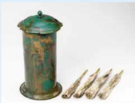
伊予市 堂ヶ谷経塚出土経筒・経巻

経典を容器に納め埋めた経塚は、経典をはるか未来まで残すためにつくられたタイムカプセルです。平安時代末期より極楽往生や追善供養のため盛んに営まれるようになり、鎌倉時代にかけて流行しました。本展では保存修理を行った県内最古の紀年銘をもつ堂ヶ谷経塚出土品を初公開します。さらに初の里帰りとなる松溪経塚出土品や陶磁器としても価値の高い石手寺経塚出土品など、県内各地の経塚出土の名品や埋納された仏教遺物も紹介。経典を埋めるという行為や込められた祈りに注目し、経塚の魅力に迫ります。