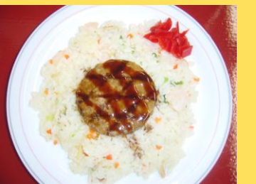
ハンバーグピラフ 550円