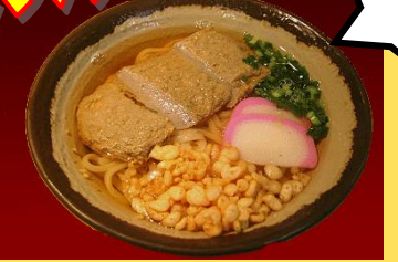
じゃこ天うどん 500円