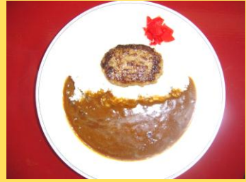
ハンバーグカレー 550円