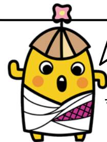
歴博 マスコットキャラクター はに坊