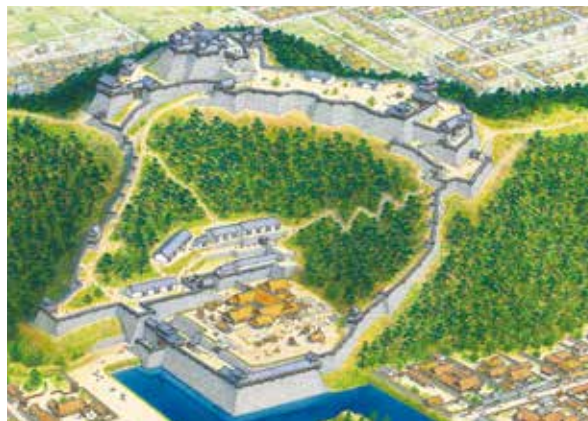
江戸時代初期の松山城 著作(作画):香川元太郎氏 当館蔵

迷路・かくし絵の絵本作家で知られる香川元太郎氏は、歴史考証イラストの第一人者としても有名です。本展は、近年制作された「松山城」「今治城」など愛媛県内の城郭をはじめ、全国各地の城郭を描いた香川氏の作品を紹介するとともに、愛媛県内の城郭に関する資料も展示します。精密に描写された日本・愛媛の名城の世界をお楽しみください。