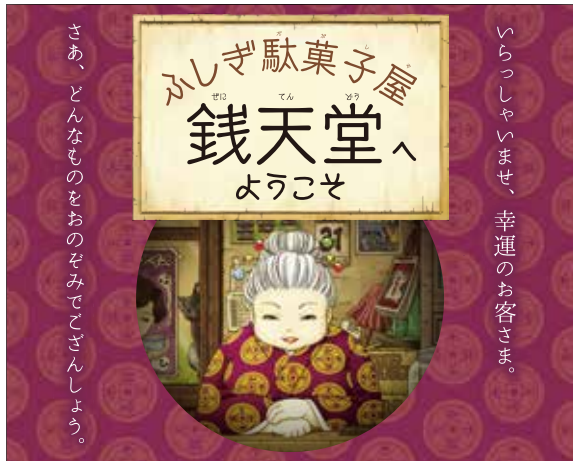
© 廣嶋 玲子, jyajya / 偕成社

幸運な人だけがたどりつける、ふしぎな駄菓子屋。でも食べ方や使い方を間違えると……。はたしてその駄菓子屋は幸運を呼ぶか？ はたまた不幸をまねくか……。子どもから大人までを虜にする児童書「ふしぎ駄菓子屋 銭天堂」シリーズの世界を多彩な資料とジオラマで紹介する展覧会です。会場には楽しいフォトスポットもいっぱい。魅力あふれる銭天堂へぜひご来店ください。