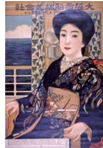
大阪商船株式会社ポスター 大正4(1915)年頃 当館蔵

令和6年は瀬戸内海国立公園の指定から90周年を迎えます。この記念すべき年に、県美術館、県総合科学博物館と連携して、同時期に瀬戸内海についての展覧会を開催します。当館のテーマは「瀬戸内ツーリズム」。近世の名所巡りに始まり、近代の瀬戸内海の美の発見を契機に、多くの人が訪れた瀬戸内の魅力を、それぞれの時代の旅日記や紀行文、絵画、写真など多彩な資料を通じて紹介します。