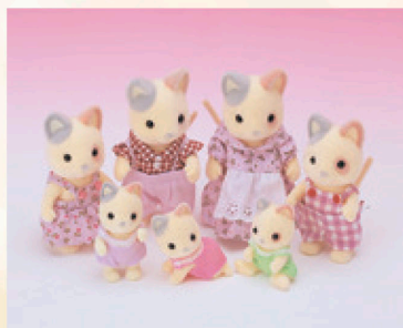
ネコファミリー(ミケタイプ) 1996年