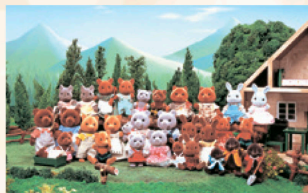
シルバニアファミリー集合写真(初代) 1985年