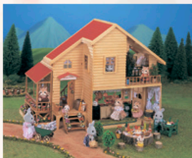
赤い屋根の大きなお家 1995年

※会期中のイベント情報は、博物館ホームページをご覧ください。 ※新型コロナウイルス感染症拡大防止のため、予定を変更、または中止する場合がございます。あらかじめご了承ください。