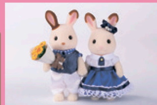
キュートカップルセット 2,970円