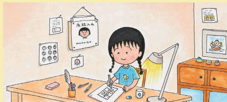
仕仕事の風景 イメージ図 原画