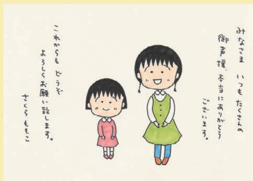
アニメ放送 1000 回記念 イラスト 2012 年