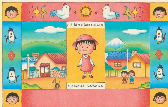
ちびまる子ちゃん イラスト付き切手 原画 2005 年

1986 年、少女漫画雑誌『りぼん』（集英社）で連載が開始した「ちびまる子ちゃん」は、1990 年にアニメ放送が始まり、2020 年に放送開始 30 周年を迎えました。明るくてユーモアがあるまるちゃんと仲間たちが繰り広げる日常を描き、日曜夕方のお茶の間は笑いで包まれています。