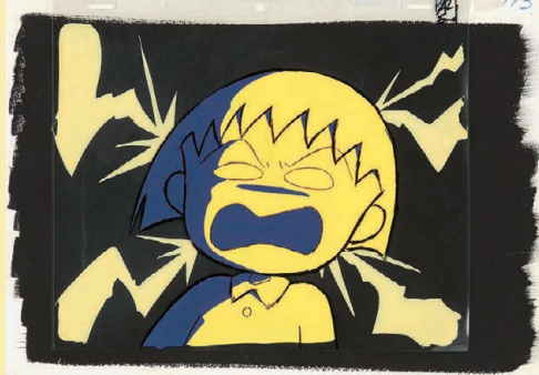
「まる子 浅草へ行く」の巻 セル画・背景 1996 年