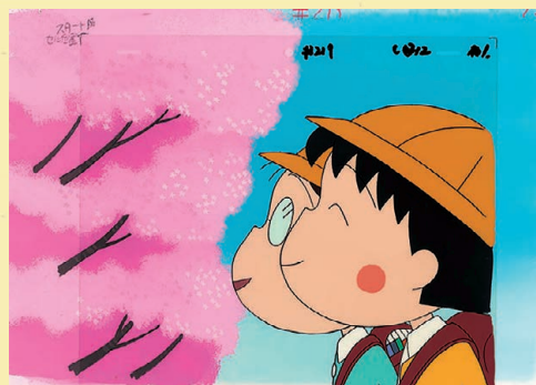
「春の巴川の一曰」の巻 セル画・背景 1999 年