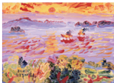
野間仁根 瀬戸内海（愛媛県美術館蔵）