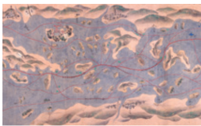
西国海路図巻（当館蔵）