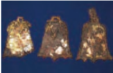
東温市川上神社古墳出土鐘形杏葉

この展示では、当館の保管資料を中心にした古墳副葬遺物をもとに、愛媛の古墳文化を紹介しています。特に、最近当館で保存処理及び資料整理が完了した今治市相の谷1号墳出土遺物にスポットを当て、当館の資料保存及び整理の成果を公開中です。また、県指定文化財である金子山古墳出土遺物（新居浜市）及び川上神社古墳出土遺物