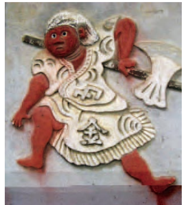
年代 明治時代中期 サイズ 縦一六・三cm、横一〇cm 所蔵 当館蔵

鰻絵は左官職人が鰻で立体的に描いた漆喰絵のことです。伊豆（静岡県）の左官入江長八が起源とされ、明治時代に全国に広まりました。