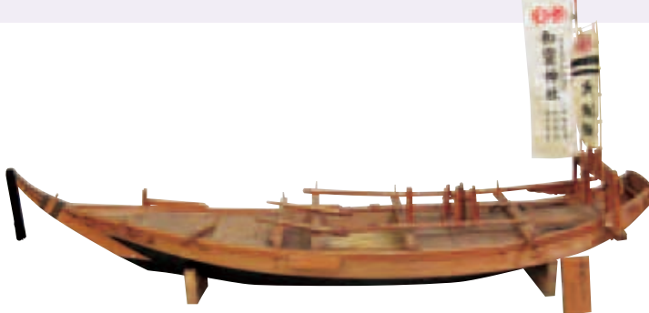
鯛船曳網 船模型／愛媛県漁業協同組合連合会宇和島支部蔵