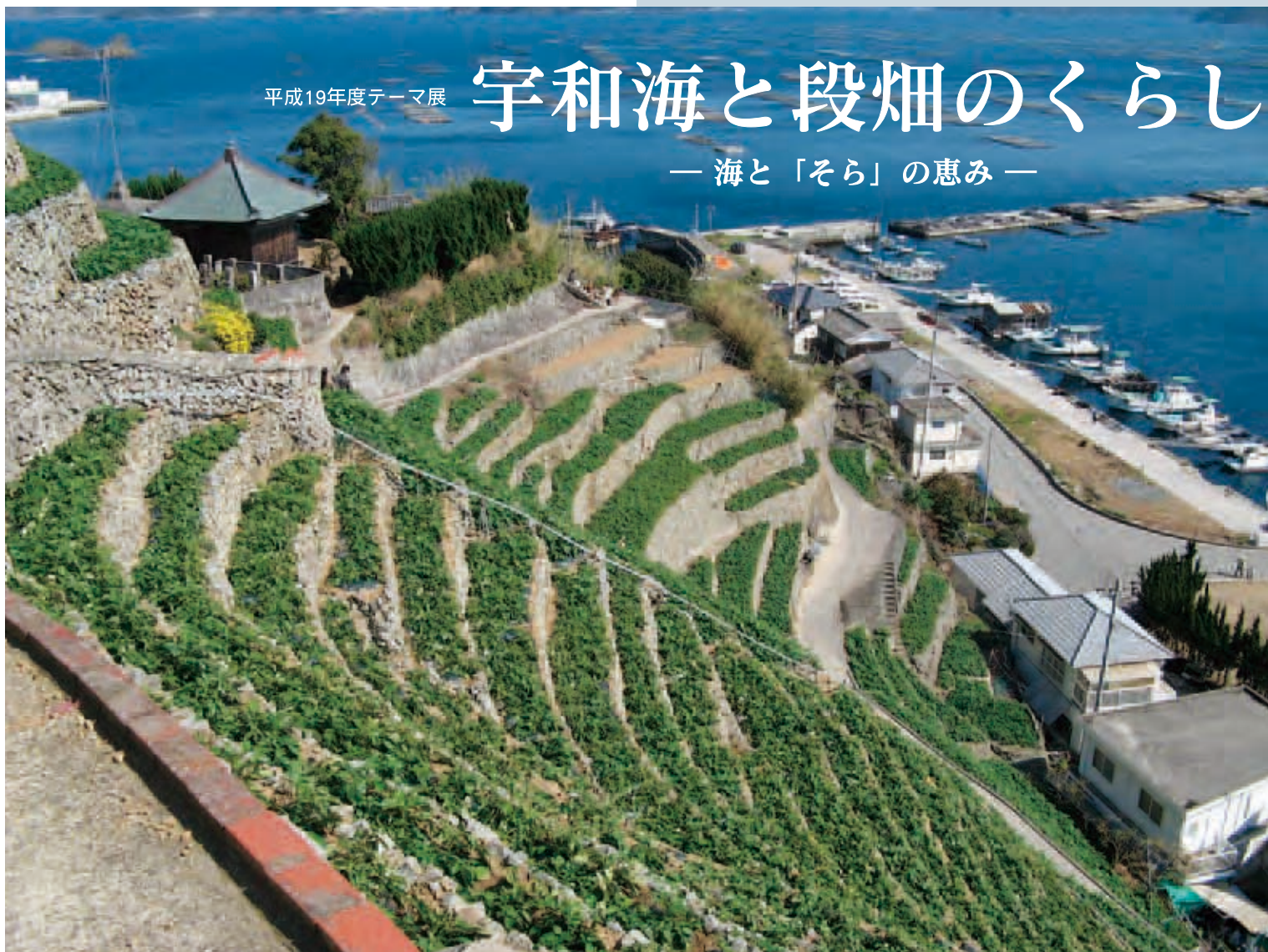
水荷浦の段畑と宇和海

ゆす みずがうら 遊子・水荷浦の段畑が文化財になりました！！ 宇和海と段畑で生きてきた人々の歩みを、原田政章氏の写真 や水荷浦で使われてきた道具などで振り返ります。