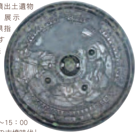
今治市相の谷1号墳出土画像鏡

（東温市）を借用・展示し、県民の宝である県指定文化財を広く公開するものです。展示は来年の2月24日〔日〕までです。この機会に是非ご覧ください。