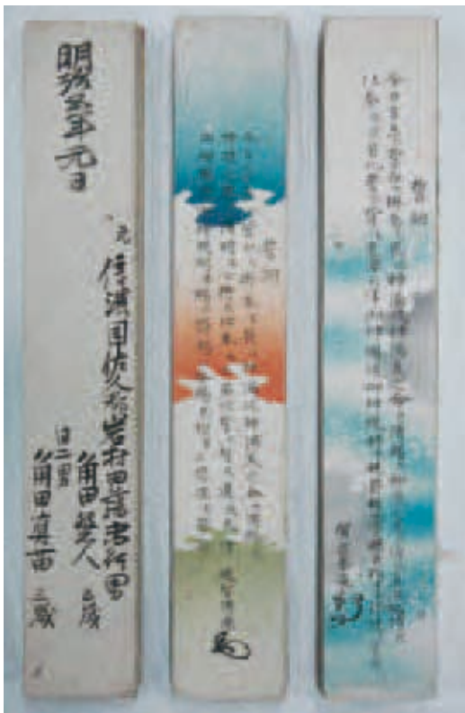
年代：江戸時代後期～明治時代前期 サイズ：縦31.0cm×横5.4cm 所蔵：個人蔵・当館保管

てしまい、当時の人々が土地の神を祀る祠に納めたのでしょう。この地域は、古墳時代が終わる7世紀頃まで首長クラスの古墳が継続して造られている県内でも珍しい地域の一つです。この三角縁神獣鏡も当地域の首長が畿内の王権から手に入れ、古墳に納めたものでしょう。破片となった資料からも千数百年前の地域の首長と畿内の王権との関連を知ることができます。