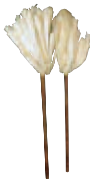
ザイ／明浜歴史民俗資料館蔵