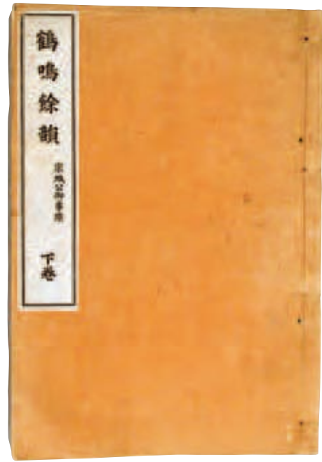
年代：大正3(1914)年 サイズ：縦26.2cm×横18.1cm 所蔵：当館蔵

和綴じの書籍は、宇和島藩八代藩主伊達宗城の人となり様々なエピソードを交えて叙述した伝記文献です。