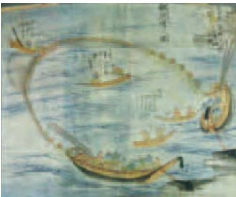
鯛曳網之図「漁業旧慣調」より／愛媛県立図書館蔵