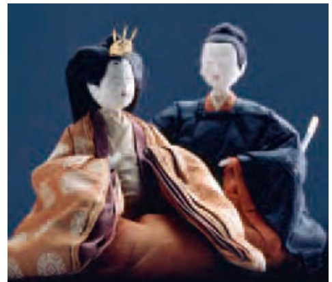
有職雛 (西条藩松平家伝来)

西条藩松平家の雛飾りや明治天皇・皇后の変わり雛まで、多彩なおひなさまを桃の節句にあわせて公開します。春のおだやかな一時、おひなさまに会いにきませんか。