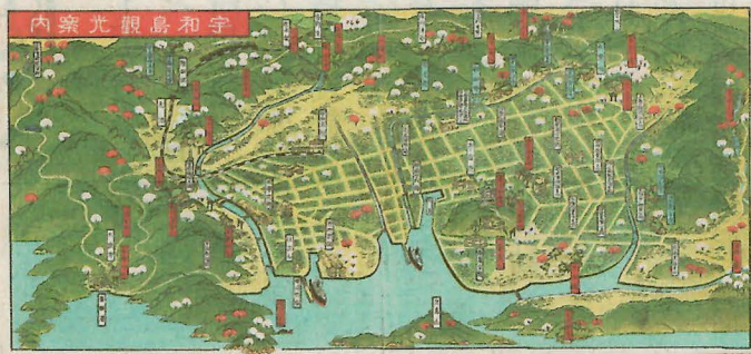
1935年ごろに制作された鳥瞰図「宇和島観光案内」 —県歴史文化博物館蔵